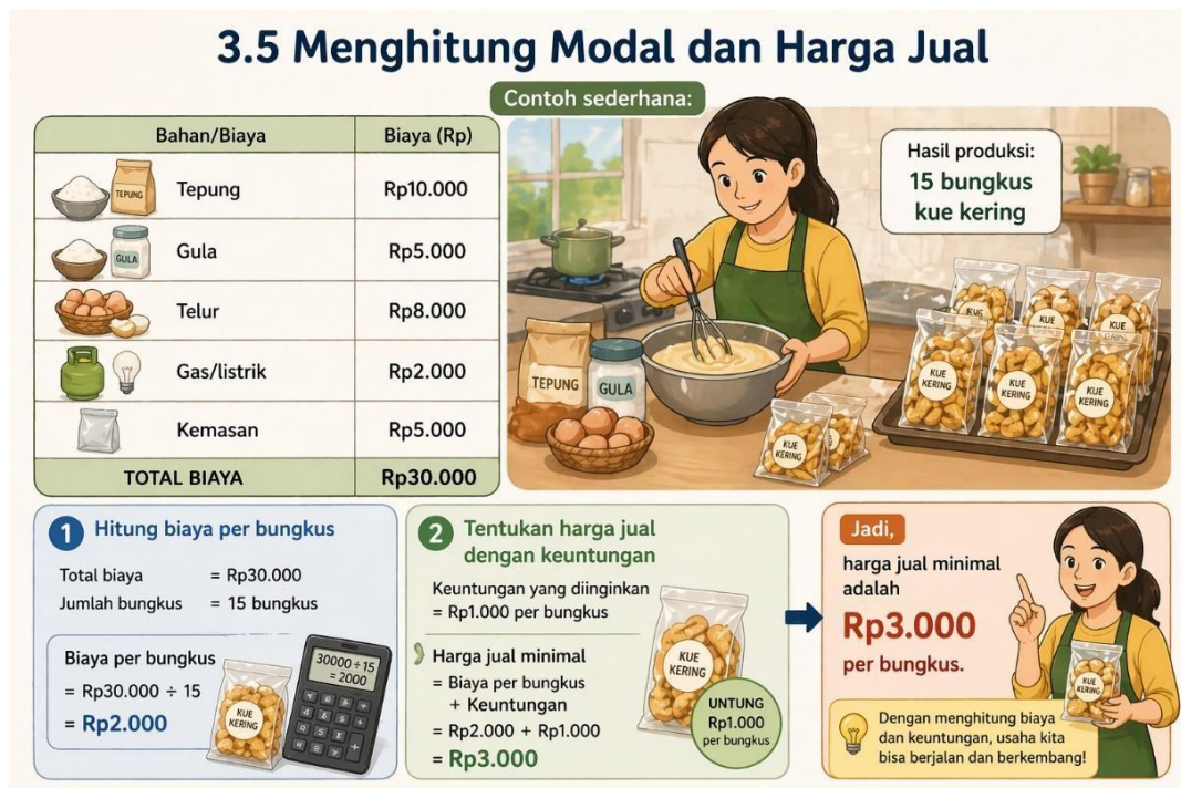
Gambar 5 Menghitung Modal dan Harga Jual

Setelah memahami unsur dasar dalam menjalankan usaha, peserta perlu memiliki kemampuan sederhana dalam menghitung modal dan menentukan harga jual. Banyak pelaku usaha kecil mengalami kesulitan berkembang karena tidak mengetahui secara pasti berapa biaya yang dikeluarkan dan berapa harga yang seharusnya ditetapkan. Oleh karena itu, penting bagi peserta untuk memahami cara menghitung biaya produksi secara sederhana sebagai dasar dalam menentukan harga jual yang menguntungkan.