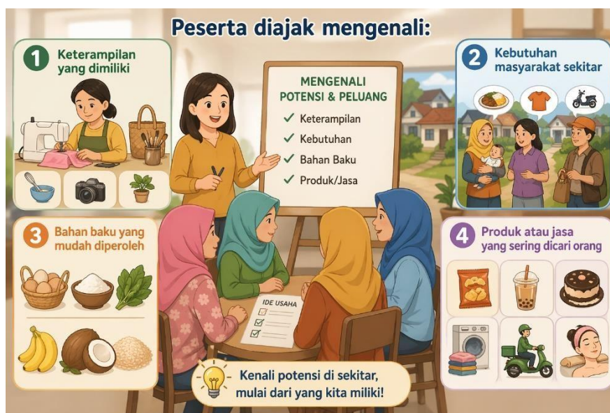
Gambar 2 Mengidentifikasi Potensi Diri dan Potensi Lokal

Dalam membangun kemandirian ekonomi keluarga, langkah pertama yang penting adalah mengenali potensi yang dimiliki serta peluang yang ada di lingkungan sekitar. Peserta tidak langsung diajak untuk berjualan, tetapi terlebih dahulu diajak memahami apa yang mereka miliki dan apa yang dibutuhkan oleh masyarakat. Melalui pendekatan ini, diharapkan peserta dapat menemukan ide usaha yang sesuai dengan kondisi nyata, mudah dijalankan, dan memiliki peluang berkembang.