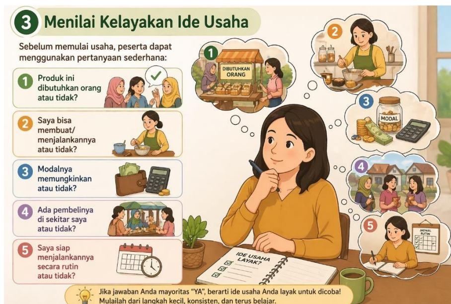
Gambar 3 Menilai Kelayakan Ide Usaha

Setelah peserta mampu mengenali potensi diri dan peluang di lingkungan sekitar, langkah berikutnya adalah menilai apakah ide usaha tersebut layak untuk dijalankan. Banyak usaha gagal bukan karena idenya buruk, tetapi karena tidak melalui proses pertimbangan yang matang. Oleh karena itu, diperlukan cara sederhana namun efektif untuk membantu peserta mengevaluasi ide usaha sebelum benar-benar memulainya.