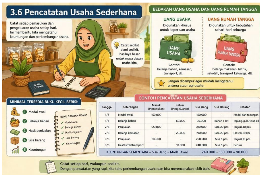
Gambar 6 Pencatatan Usaha Sederhana

Selain mampu menghitung modal dan menentukan harga jual, peserta juga perlu memahami pentingnya pencatatan usaha secara sederhana. Banyak usaha kecil sulit berkembang karena tidak memiliki catatan keuangan yang jelas, sehingga pelaku usaha tidak mengetahui apakah usahanya untung atau rugi. Oleh karena itu, pencatatan usaha menjadi langkah penting untuk membantu peserta mengelola keuangan usaha dengan lebih tertib dan terarah.