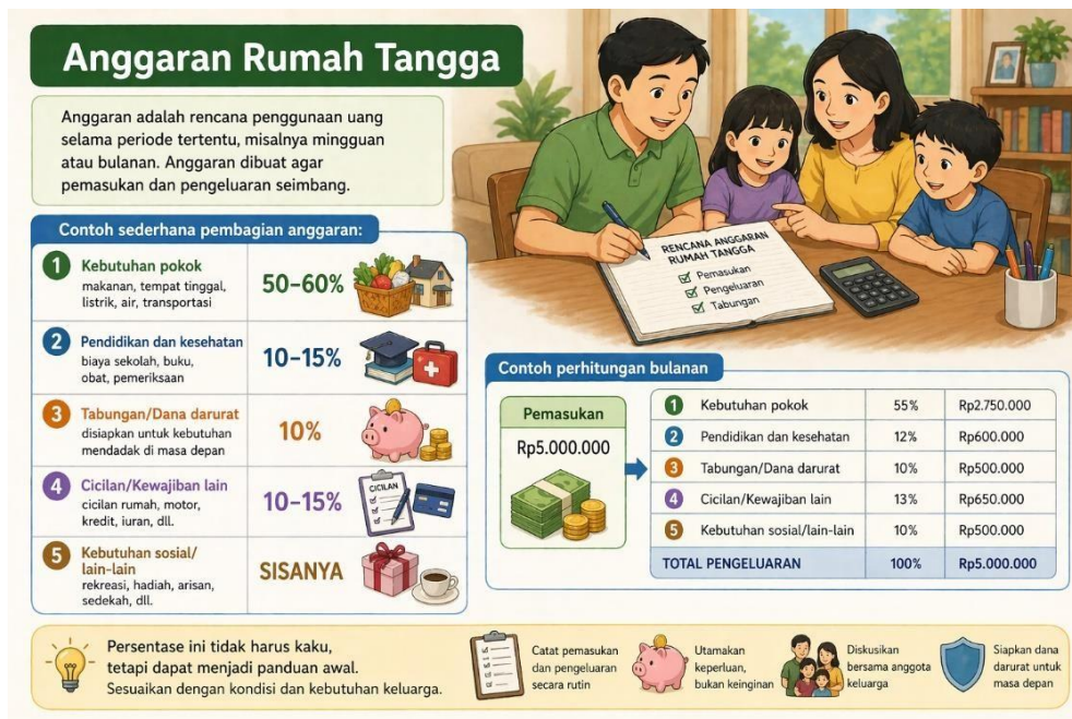
Gambar 1 Anggaran Rumah Tangga