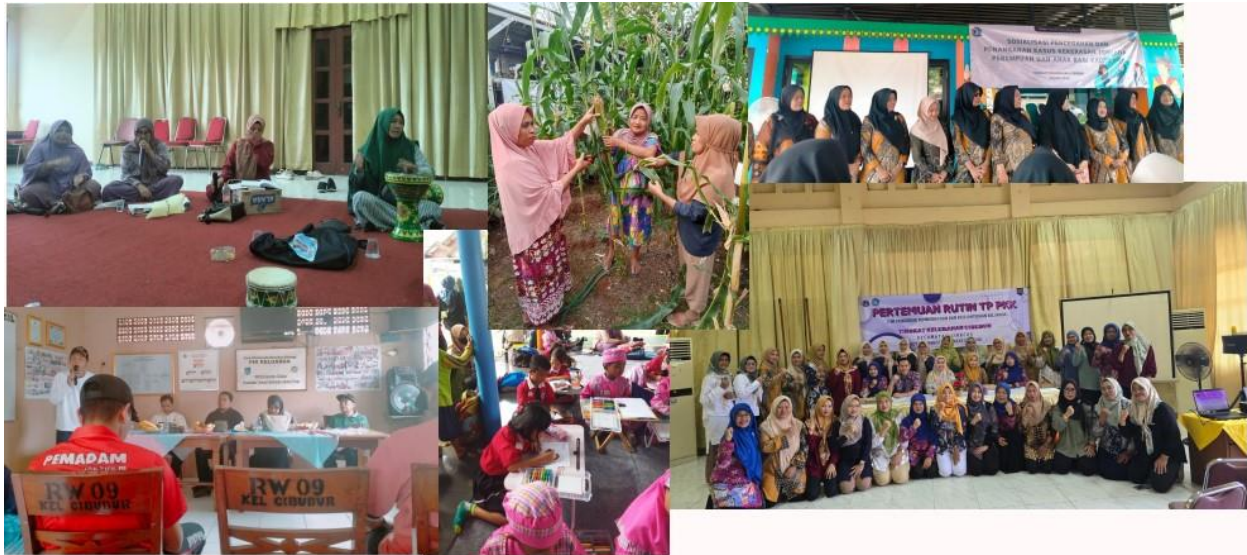
Gambar 2. Kegiatan anggota PKK RW 013 Kelurahan Cibubur

terutama terkait dengan peningkatan kapasitas dalam bidang digitalisasi dan penguasaan bahasa asing, khususnya Bahasa Inggris.