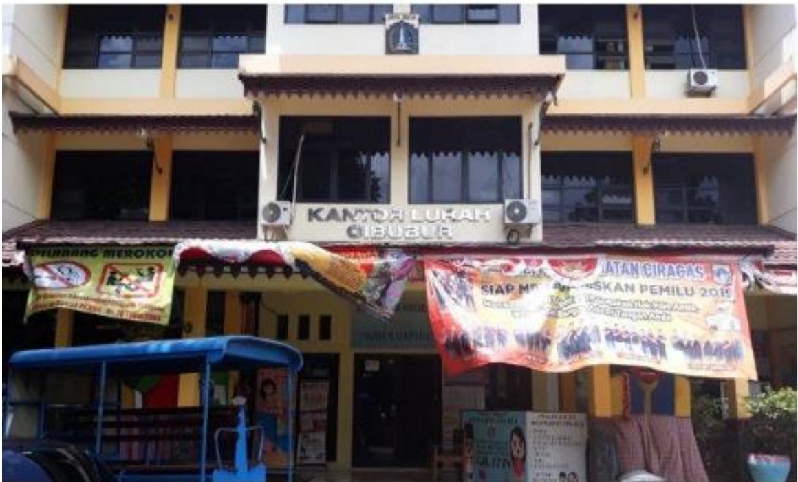
Gambar 1. Sekretariat PKK RW 013 Kel Cibubur

Kelurahan Cibubur, yang terletak di Kecamatan Cipayung, Jakarta Timur, merupakan salah satu wilayah yang terus mengalami pertumbuhan, baik dari sisi infrastruktur maupun kepadatan penduduk. Di tengah dinamika perkembangan urban ini, RW 013 menjadi salah satu lingkungan yang aktif menjalankan berbagai kegiatan pemberdayaan masyarakat, salah satunya melalui peran Kelompok Pemberdayaan dan Kesejahteraan Keluarga (PKK). PKK RW 013 dikenal sebagai kelompok ibu-ibu yang solid dan memiliki semangat tinggi dalam menjalankan program-program kemasyarakatan, seperti posyandu, arisan, pengajian, pelatihan kewirausahaan, dan kegiatan gotong royong. Namun demikian, kelompok ini juga menghadapi sejumlah tantangan,