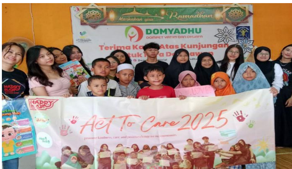
Gambar 5. Volunteer Advocare Berbagi Ilmu dengan Anak Yatim Dhuafa