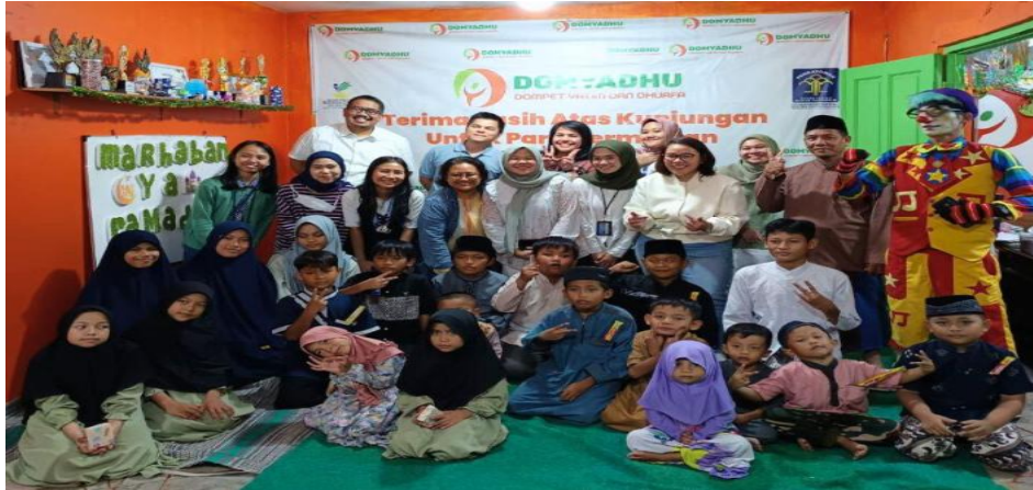
Gambar 3. Buka Bersama dan Santunan