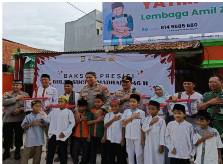
Gambar 4. Kegiatan Baksos Presisi Ramadhan 1446 dari POLDA METRO JAYA