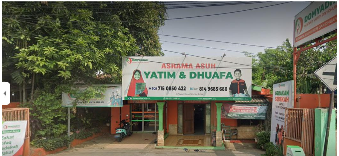
Gambar 1. Penampakan Gerbang Utama Asrama Asuh LAZNAS Dompot Yatim dan Dhuafa (DOMYADHU) Pesanggrahan

kehidupan dan masa depan anak-anak. Menjadikan anak-anak yang maju membutuhkan ketrampilan dalam pengelolaan keuangan. Oleh karena itu perlu diadakan suatu edukasi cerdas mengatur keuangan melalui media sosial berupa webinar atau video tentang rajin menabung sejak dini. Tim PKM mengharapkan manajemen asrama ikut serta dalam membimbing anak-anak agar mereka mampu mengelola keuangan dengan baik sejak dini.