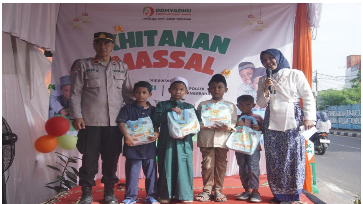
Gambar 2. Khitanan Massal di Akhir Tahun 2024